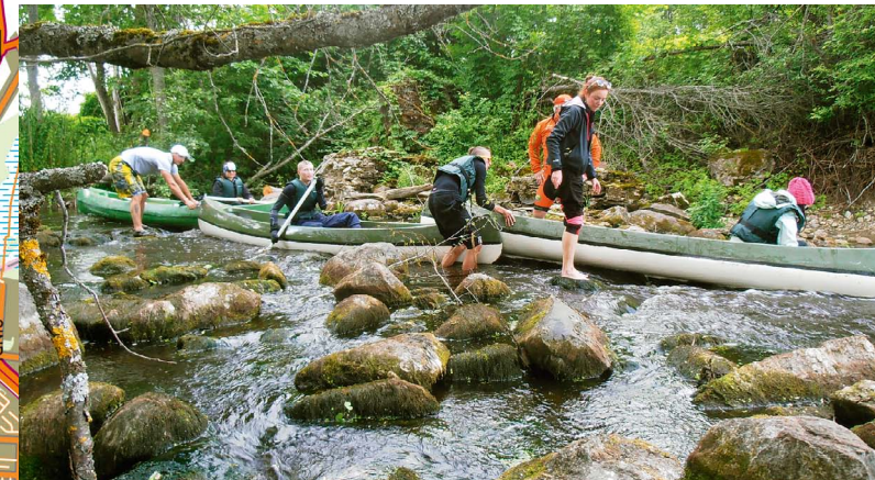
VEETURISMI MARSRUUDID JA JÕELE JUURDEPÄÄS MARSRUTI UN PIEEJAS PUNKTI UPEI

8 VILLA MEREMETSA ~ 50 m +372 501 8850, www.meremetsa.ee