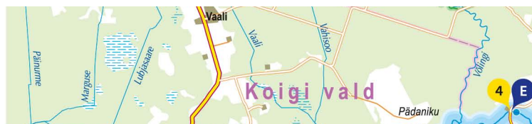
VEETURISMI MARSRUUDID JA JÖELE JUURDEPÄÄS / MARSRUUTI UN PIEEJAS PUNKTI UPEI